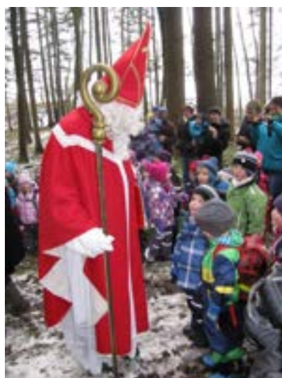
Nikolaus im Wald