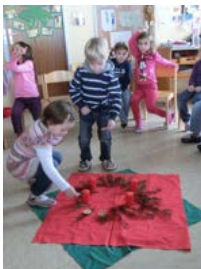
Legebild zum Advent

Es ist für uns selbstverständlich, dass unsere Kinder das Kirchenjahr mit seinen vielfältigen und traditionsreichen Festen und Feiern miterleben und mitgestalten wie z.B. Advent, Weihnachten, Ostern, Himmelfahrt ... Aber auch kleinere Ereignisse wie Lichtmess oder Maria Geburt werden miterlebt. Dabei erfahren die Kinder nicht nur den Reichtum des katholischen Glaubens, sondern ebenso ein tragfähiges, geborgenheitsstiftendes Miteinander.